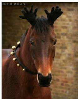
„No jo, zima na krku.“