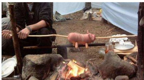
grilovačka v době krize

☺ Jednou večer se takhle policista postavil naproti jednomu baru a čekal, jestli po zavíračce chytne někoho pro alkohol za volantem. Když začali z baru vycházet lidi, hned si všiml jednoho, který se doslova vypoťoval a začal se motat mezi auty. Vyzkoušel klíčky u pěti z nich, než našel svoje. Pak seděl pět minut na předním sedadle ohnutý pod volantem a zápasil s klíčky. Tou dobou už všichni ostatní hosté vyšli z baru a odjeli. Když konečně motor naskočil, policista neváhal a vyrazil kupředu. Postavil se před rozjíždějící auto. Nechal muže vystoupit a fouknout do balónku. A nic! Policajt udiveně říká: „Docebule, jak je tohle možné?“ A chlápek mu povídá: „No, dneska sem byl jako volavka určenej já.“